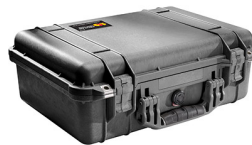
1500NF No Foam