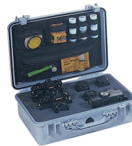
1508 Organizador de tapa para material de fotografía