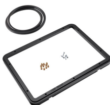
1400PF Panel de adaptación para aplicación especial