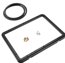
1400PF Panel de adaptación para aplicación especial