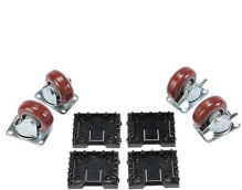
0507 Kit de ruedas