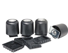
0508 Kit elevador de palés