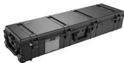
1770NF No Foam