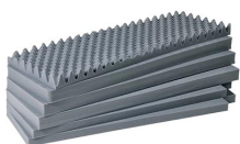
1741 Juego de 6 piezas de espuma de recambio