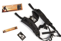
RucPac-normal Conversión de mochila RucPac estándar Hardcase