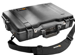
1495NF No Foam