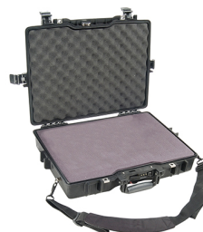
1495WF With Foam