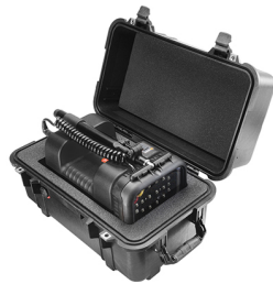
1460AALG With Custom Foam for 9430 / 9435