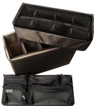
1445 Divisores acolchados y organizador de tapa para accesorios