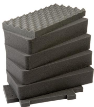
1441 Juego de 6 piezas de espuma de recambio