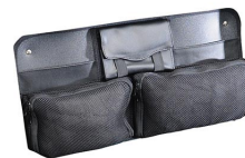
1449 Organizador de tapa para material de oficina