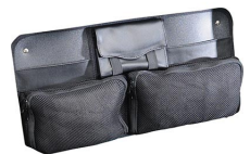
1449 Organizador de tapa para material de oficina