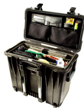
1446 Divisores y organizador de tapa para material de oficina