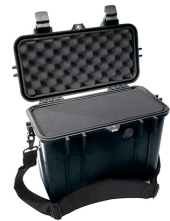
1430WF With Foam