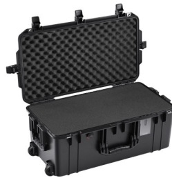
1606WF With Foam