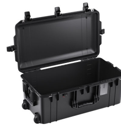
1606NF No Foam