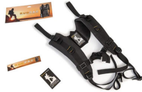
RucPac-normal Conversión de mochila RucPac estándar Hardcase