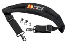
iM-STRAP-S-VER2 Correa para hombro acolchada