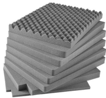
iM2750-FOAM Juego de 8 piezas de espuma de recambio