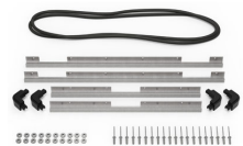
iM2700-M4-BEZEL-L Bisel de la tapa (métrico)