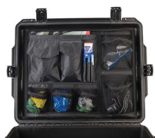
iM27XX-UTILITYORG Organizador de accesorios