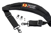
iM-STRAP-S-VER2 Correa para hombro acolchada