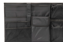
iM26XX-UTILITYORG Organizador de accesorios