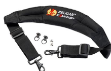
iM-STRAP-S-VER2 Correa para hombro acolchada