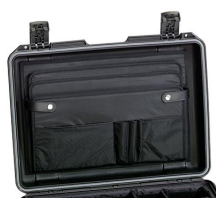
iM26XX-LIDORG Organizador de tapa