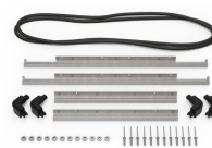
iM2620-M4-BEZEL-L Bisel de la tapa (métrico)