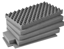
iM2500-FOAM Juego de 5 piezas de espuma de recambio