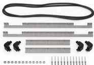
iM2500-M4-BEZEL-L Bisel de la tapa (métrico)