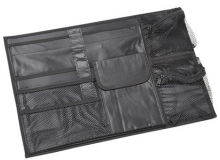
iM2500-UTILITYORG Organizador de accesorios