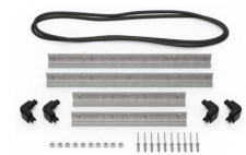
iM2450-MBEZ-B Bisel de la base (métrico)