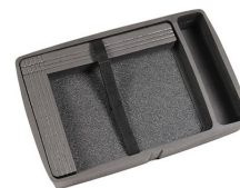
iM2370-COMPTRAY Bandeja para portátil