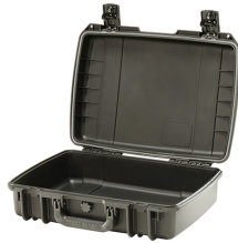
iM2370-X0000 No Foam