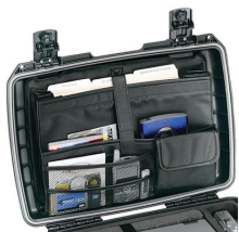
iM2370-UTILITYORG Organizador de accesorios