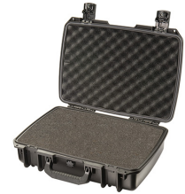
iM2370-X0001 With Foam