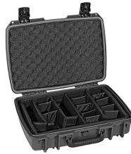
iM2370-X0002 With Padded Dividers