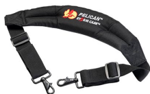
iM2370-STRAP-S Correa para hombro acolchada removible