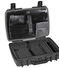
iM2370-X0003 Computer Case Deluxe