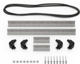
iM2306-MBEZ-B Bisel de la base (métrico)