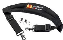
iM-STRAP-S-VER2 Correa para hombro acolchada