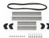
iM2100-MBEZ-B Bisel de la base (métrico)