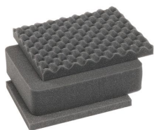
iM2050-FOAM Juego de 3 piezas de espuma de recambio