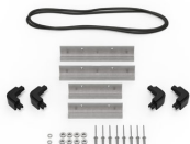
iM20XX-M4-BEZEL Bisel de la base (métrico)