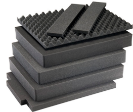
1637AirFS Juego de 7 piezas de espuma de recambio