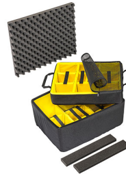
1607AirDS Divisores acolchados