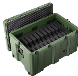
472-10-LAPTOP-S With Black Stainless Steel Hardware