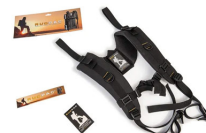
RucPac-normal RucPac Standard Hardcase Rucksack-Konvertierung