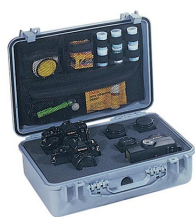
1508 Deckeleinteiler für Fotografen