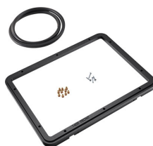
1400PF Panelrahmen für Spezialanwendungen