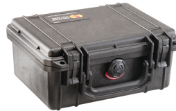
1150NF No Foam