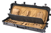
472-PWC-DW3200-BLK-COY Black Case With Coyote Soft Case