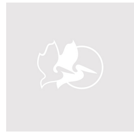
AL3620-1710RPFC With Foam, With Casters