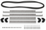
iM2600-M4-BEZEL-L Deckel-Lünette (metrisch)