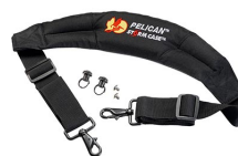
iM-STRAP-S-VER2 Padded Shoulder Strap