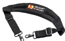
iM2370-STRAP-S Removal Padded Shoulder Strap