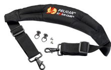
iM-STRAP-S-VER2 Padded Shoulder Strap