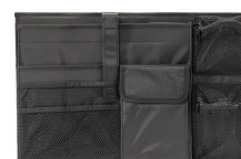
iM26XX-UTILITYORG Organizador de accesorios