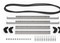
iM2620-M4-BEZEL-L Bisel de la tapa (métrico)