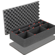
1555TPKIT TrekPak Koffer Teiler Kit