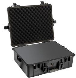
1600WF With Foam