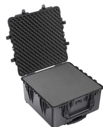
1640WF With Foam