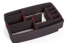
1510EUTP TrekPak Koffer Teiler Kit