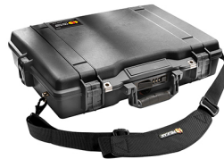
1495NF No Foam