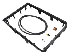
1470PF Panelrahmen für Spezialanwendungen