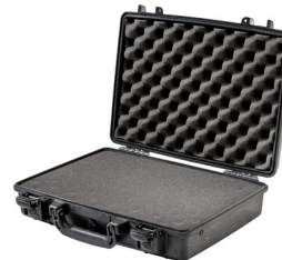
1470WF With Foam