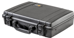
1470NF No Foam