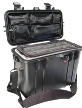
1434 With Padded Dividers & Lid Organizer