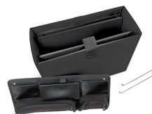
1436 Office Divider Kit