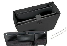
1436 Office Divider Kit