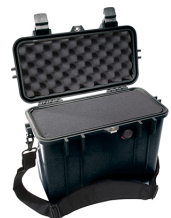
1430WF With Foam