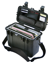
1437 With Padded Office Divider Set & Lid Organizer