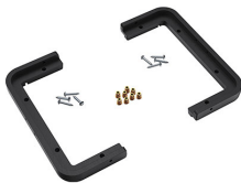
1430PF Panelrahmen für Spezialanwendungen