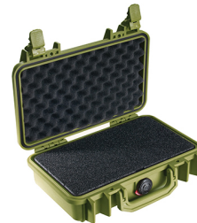
1170WF With Foam