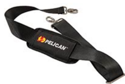
9487 Padded Shoulder Strap