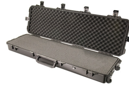
iM3300-X0001 With Foam