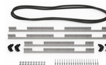
iM3075-M4-BEZEL-L Deckel-Lünette (metrisch)