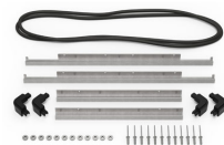
iM2620-M4-BEZEL-L Deckel-Lünette (metrisch)