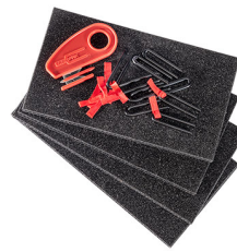
1506TPKIT TrekPak Koffer Teiler Kit