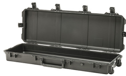
iM3200-X0000 No Foam